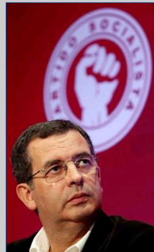
Hackers não dão tréguas