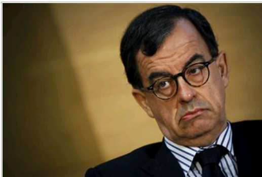
Conselho de Prevenção da corrupção vai acompanhar de perto processos de privatizações

Lisboa, 09 dez (Lusa) - O Conselho de Prevenção da Corrupção (CPC) vai acompanhar de perto o processo de privatizações, seja com visitas ou contactos com as entidades responsáveis, entendendo que a atual situação de crise exige um "acompanhamento rigoroso".